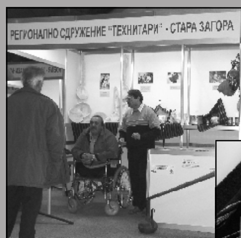
Специализираната изложба за ромски занаяти, култура и бизнес „Ромски свят“ се провежда от 3 до 6 ноември в Палата No 10 на Пловдивския панаир и е част от официалната панаирна програма. Най-голям интерес за посетителите предизвика щандът на Сдружение „Технитари“.

Сдружението е създадено през 2004 г. и основната му мисия е интегриране на етническите общности в българското общество, чрез развитие на духовната култура, традиционните човешки добродетели, съхранение на техния бит и традиционни занаяти. Сдружението предоставя социални услуги и оказва подкрепа при производството и реализацията на продуктите на занаят-